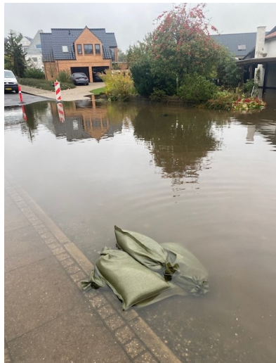
Lørdag d. 21. oktober kl. 09.50 v. Skolebakken