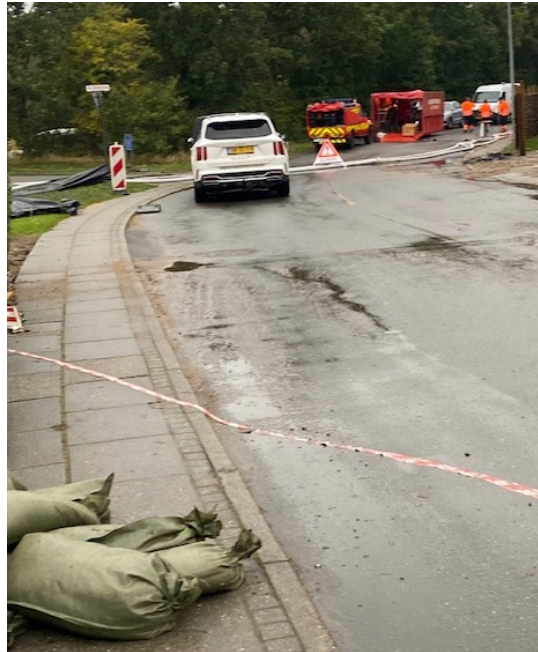
Lørdag d. 21. oktober kl. 16.40