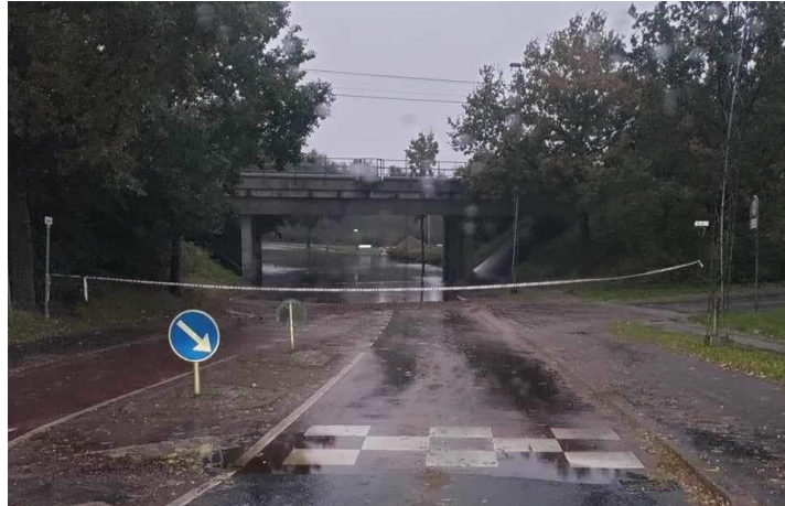
Lyshøjallé v. Fjordvej. Lørdag d. 21. oktober kl. 09.30

Lokalområdet Fjordvej, Gl. Strandvej og Lyshøjallé indgår ikke som et kritisk sted og der fremgår i rapporten ikke målinger fra dette område.