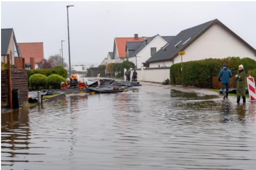
Fjordvej v. Roklubben. Lørdag d. 21. oktober kl. 09.30

Vi er naturligvis interesserede i at sikre vores hus for evt. fremtidige hændelser og det ville være fedt at blive informeret om både evt. beredskabsplan og stormflodssikring - så vi herfra kan planlægge hvor og på hvad vi skal sætte vores kræfter ind..."