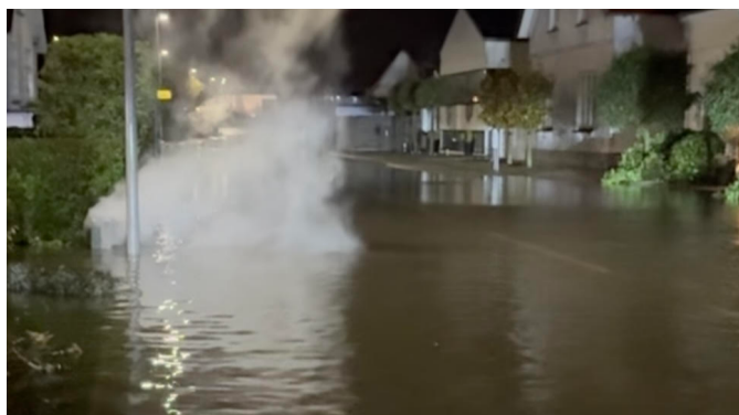
Fjordvej lørdag d. 21. oktober.